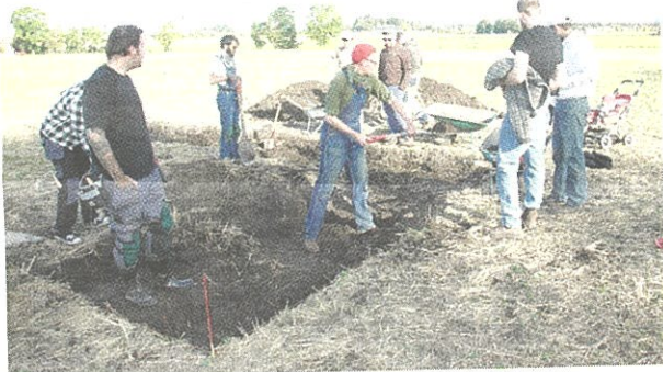
Masterstudenterna från Lund är i full gång med att gräva fram schakt i Uppåkra, här på jakt efter järnåldersugnen.

– På radarn ser man en avlång skugga och vi vet att det gått en väg här på 1700-talet men misstänker att vägen kan ha äldre anor och faktiskt även ha varit väg under järnåldern.