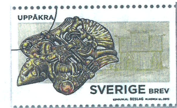
En framgång är att ett Uppåkrayfynd blivit frimärke, som nu ska säljas på Uppåkra Arkeologiskt Center.