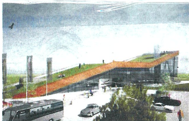
2009 ville skånska entusiaster att en arkeologisk besöksanläggning skulle kunna stå klar 2014. ARKIVBILD