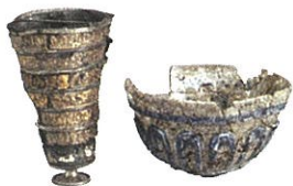
Gral och skål

Sound of Silence heter stenbänken som är skapad av konstnären Tina Apelgren. Slå dig ner, blicka ut över platsen och landskapet. I ena horisonten skimtar Malmö. I den andra skönjer man nästan ESS norr om Lund.