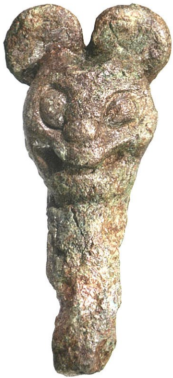
Musse Pigg

I år tar järnåldersstaden Uppåkra, dess fynd och utgrävningar flera spännande kliv framåt. Bokade visningar året om, speciell fokus på barn och barnfamiljer, en vänförening och samarbete med Tirups Örtagård, är några av nyheterna.