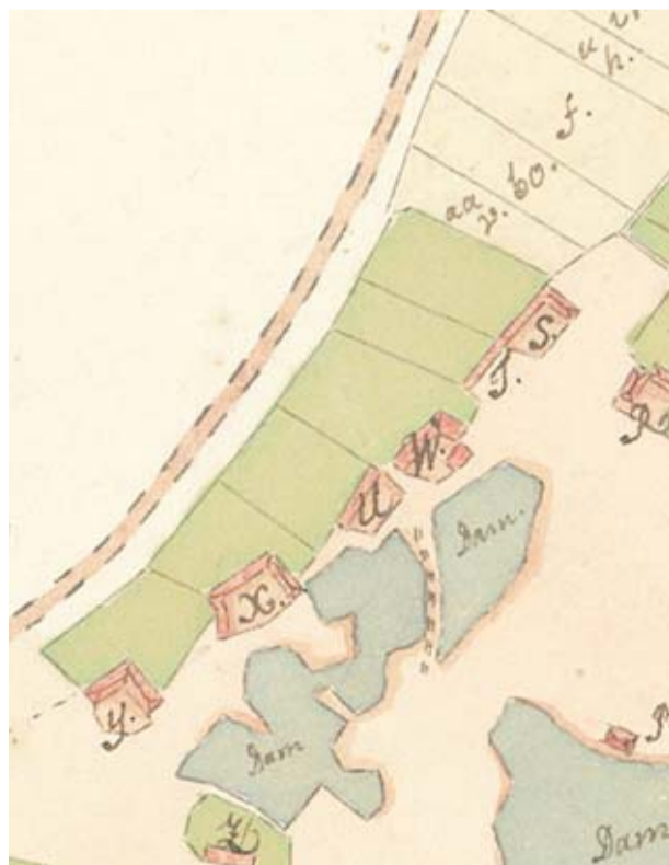
... vars läge anses motsvara de gårdar som visas på 1776 års karta över den undersökta ytan.