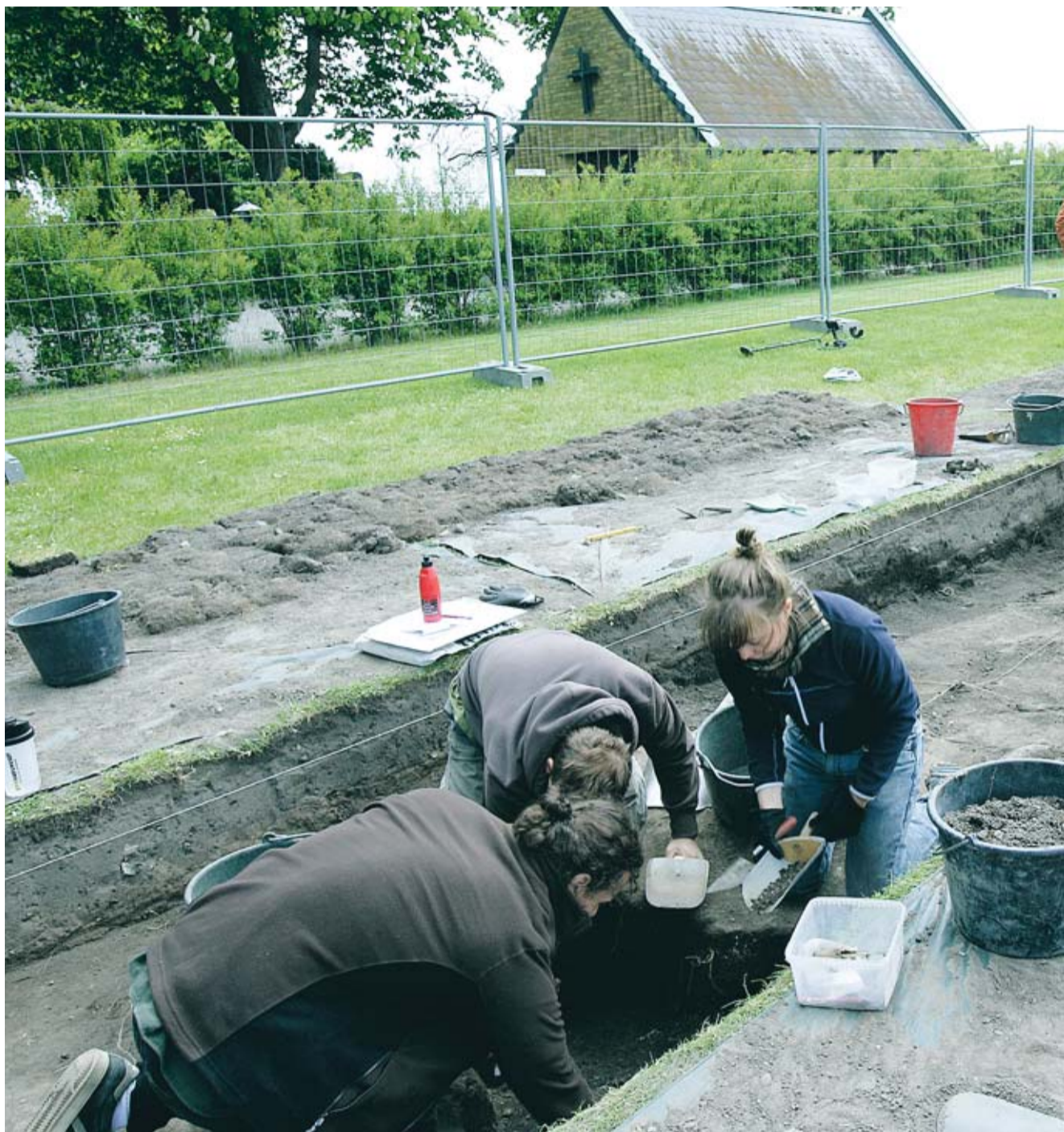
Ett nytt schakt har grävts upp en bit från den tidigare grävplatsen för att den cirkelformade fornlämning som geofysiska mätningar